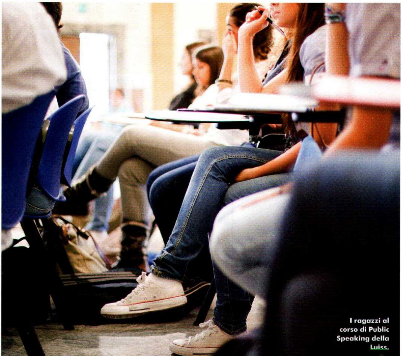
I ragazzi al corso di Public Speaking della Luiss .